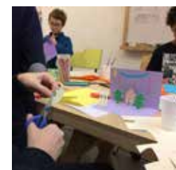
ANIME TON POP-UP

Création participative autour du cycle de l'eau à l'aide d'une maquette. Atelier pédagogique "Ricochet : le pays de l'eau". "La Ripisylve de l'Allier, une forêt pas comme les autres" : balade nature avec un éducateur à l'Environnement. Animations en partenariat avec les actions de sensibilisation mises en place dans le cadre du Plan Climat Air Energie Territorial de Mond'Arverne communauté.