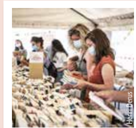
BRADERIE DES LIVRES