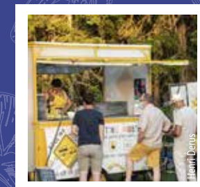
ROUL' MA SOUPE