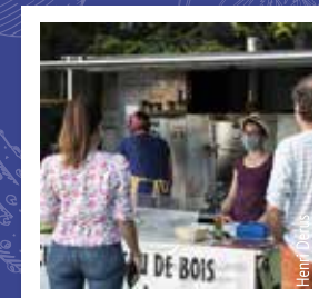
LA POPOTE MOBILE

N.B : Distributeur de billets le plus proche à Longues, transaction sur site en chèques et espèces uniquement.