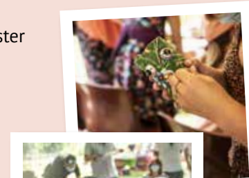
T'ES LIVRE AU FESTIVAL ?