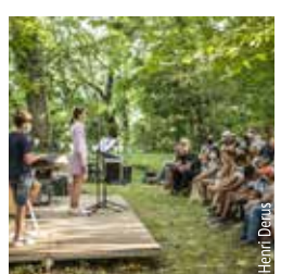
PERFORMANCE DE COLLÉGIENS

Une fantaisie dansée burlesque, s'inspirant du monde de l'enfance où notes et objets virevoltent pour détourner et réinventer les jeux des bambins.