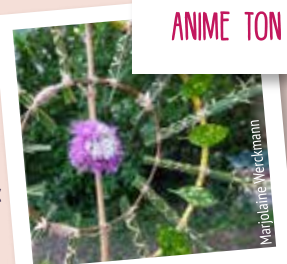
ATELIER LAND ART