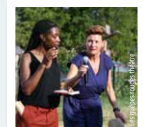
LES MOTS QUI RÉVEILLENT