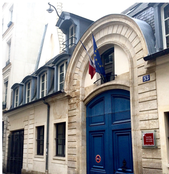
Façade CNL

Acteur économique et culturel, il participe activement au rayonnement du livre et à la création littéraire, en France et dans le monde.